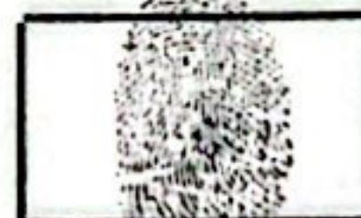
Huella Índice Derecho